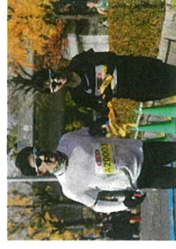
ペアラーマラソンでのスキルレ