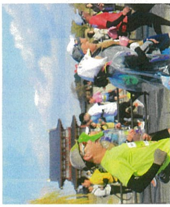
平城宮跡前を走るランナー