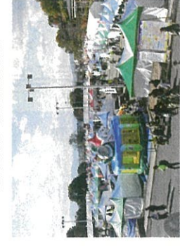
EXPOは2日間多くの来場者で賑わった