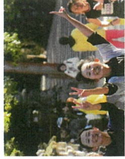
カメラに向かってポーズをとるランナー