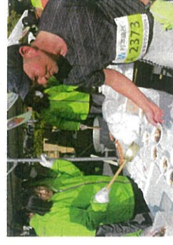
名物のぜんざいを振る舞いは大人気