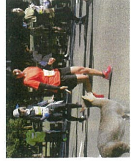
鹿と出会うのも奈良マラソンならではの