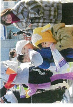
ランナーに声援を送る子供たち