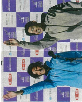
選手宣誓する2023年の優勝者