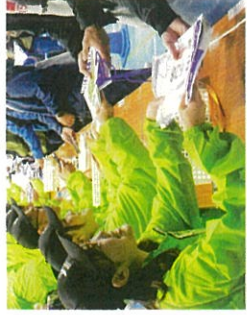
笑顔でランナー対応するボランティア