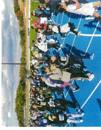
ミニ奈良マラソンには多くの小学生も参加