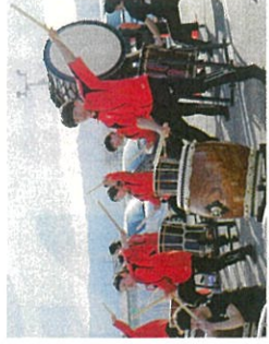
和太鼓演奏でランナーを応援