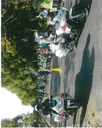
奈良県警白バイ隊が先導